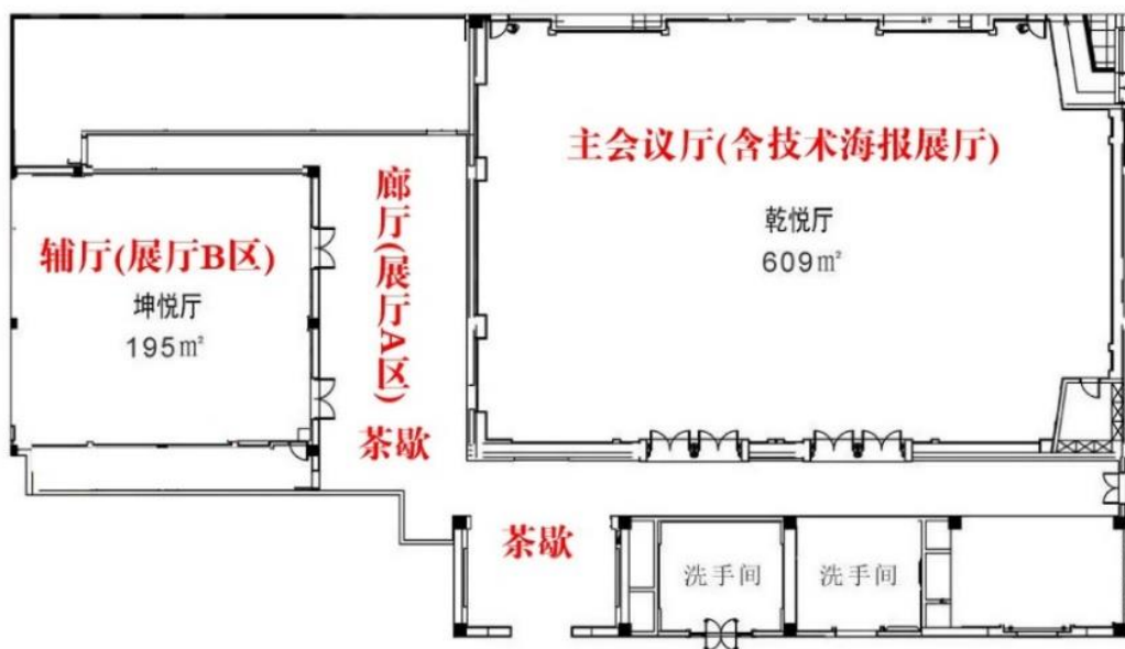
图1 会议主会场与展厅展位平面图

会议主会场与展厅均位于会议酒店海都大酒店4楼，会议主会场与展厅展位平面图如图1所示。防砂完井工具材料展厅包括廊厅(展厅A区)和辅厅(展厅B区)。